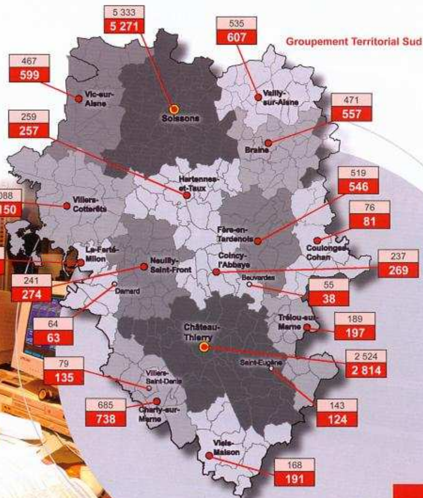
Groupement Territorial Sud

Voilà pourquoi les pompiers axonais ont réalisé 110 interventions quotidiennes ou, si vous préférez, une toutes les 13 minutes. Les 40.170 interventions ont généré 46.179 sorties, soit là aussi une augmentation de 6,55%.