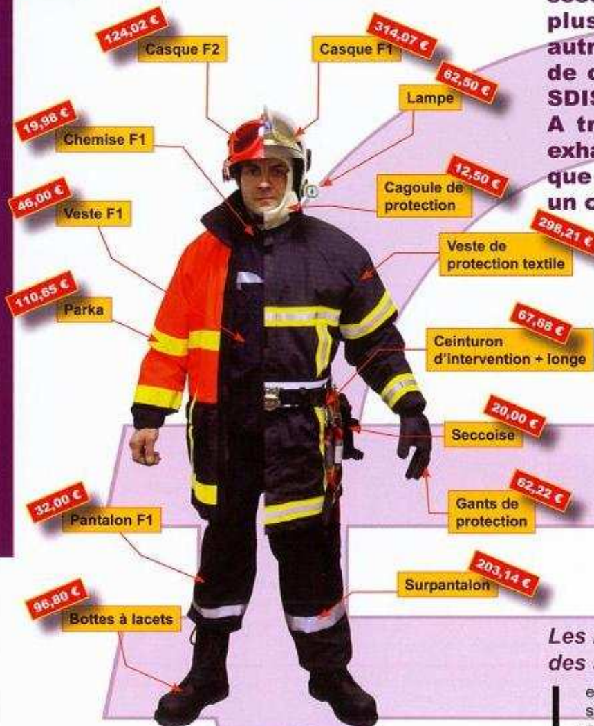
Les prix sont exprimés en H.T.

En ce début d'année, habillement et matériel, le stock du service logistique se chiffre à 439.899 €.